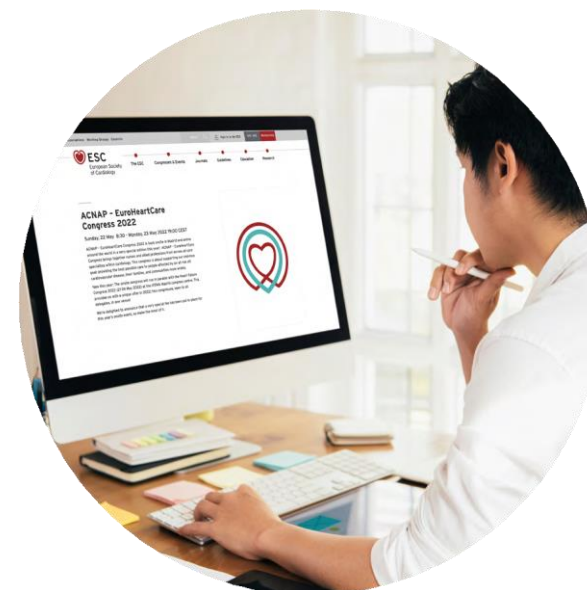
Visuel non contractuel